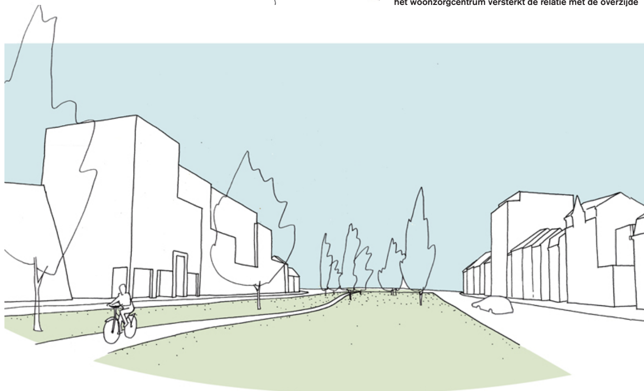
ONDER Beeld van de Speecqvest, de verticale geleding van het woonzorgcentrum versterkt de relatie met de overzijde